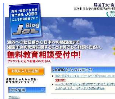
帰国子女・海外子女の受験、教育情報